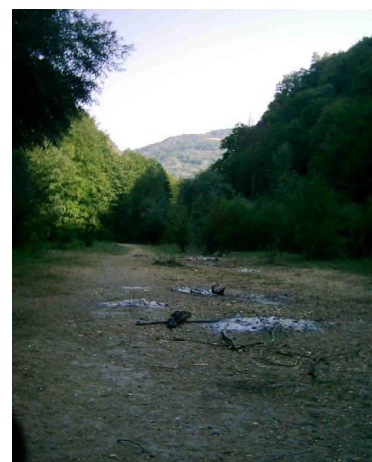
Vetre de foc în rezervția Cheile Nerei