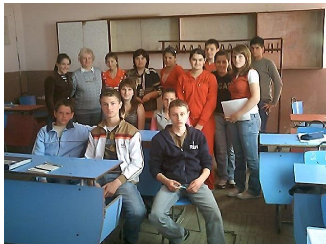
.....și a celor de la Grupul Școlar Industrial Moldova Nouă

În perioada martie – mai 2007 a fost realizat un training destinat abilitării și în final selecției voluntarilor, care vor activa în cadrul proiectului. La training au participat un număr de 84 de candidați aparținând organizațiilor GEC Nera, SPEO Caraș Oravița, SKOLA PLUS Bela Crkva și EKO BREG Vrsac, care în prezent sunt elevi sau profesori ai Liceului General Dragalina Oravița, Grupului Agroindustrial Oravița, Liceului Eftimie Murgu Bozovici, Grupului Școlar Industrial Moldova Nouă, Școlii cu clasele I- VIII Șopotu Nou, Gimnaziului Dositej Obradovici Bela Crkva și Liceului de Chimie și Medicină Vrsac