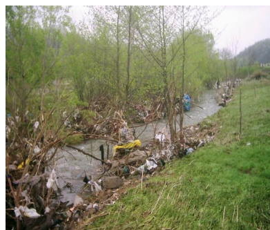
Poluare cu ambalaje si deseuri pe paraul Radimna

Monitorizarea prin proceduri standard a mediului este o activitate permanentă realizată de autoritățile statului care au obligația de a garanta cetățenilor o calitate a factorilor de mediu (apă, aer, sol) corespunzătoare menținerii unei stări normale de sănătate și confort. Autoritățile sunt obligate prin lege să furnizeze periodic populației informații oficiale privind starea factorilor de mediu.