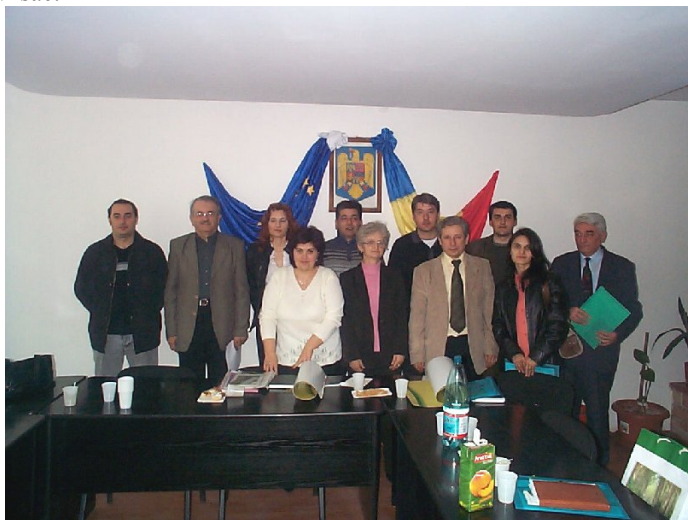
Grupul Comun de Lucru al microregiunii Dunăre – Nera - Caraș

Vineri 9 martie a.c., la sediul Consiliului Local Moldova Nouă a avut loc întâlnirea grupului comun de lucru, din cadrul secretariatului tehnic al asociației de cooperare DUNCA COOPERATION la care au participat reprezentanți ai GEC Nera, Administrației Parcul Natural Porțile de Fier, Administrației Parcul Național Cheile Nerei Beușnița, Agenției pentru Protecția Mediului Caraș – Severin, Agenției de Dezvoltare Socio – Economică a județului Caraș – Severin, Consiliului Local Moldova Nouă, Consiliului Local Oravița, Administrației Vojvodina Șume Petrovaradin și Societății Ecologice EKO BREG Vrsac.