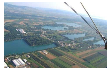
Zona turistică Jezero

În imediata apropiere a orașului se află cursurile apelor Dunării, Nerei, Carașului, Canalului Dunăre –Tisa –Dunăre și un număr mare de lacuri cristaline. De aici și denumirea orașului, căruia i se mai spune și «Veneția Voivodinei».