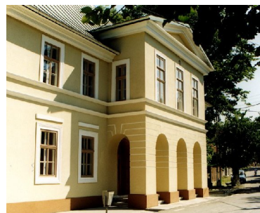
Teatrul Mihai Eminescu

Flora din acest teritoriu prezintă unele caracteristici ale unui climat cu influențe mediteraniene: crește smochinul, castanul, liliacul și migdalul. Oravița este înconjurată de păduri de foioase și conifere.