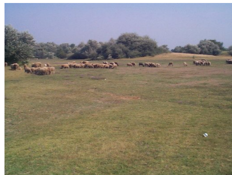
Pasunat ilegal in rezervația naturala Balta Nera - Dunare

Activitatea constă într-o informare cât mai rapidă, prin mesaje telefonice sau, verbal , a autorităților responsabile cu protecția mediului, în legătură cu evenimente majore constatate de voluntari