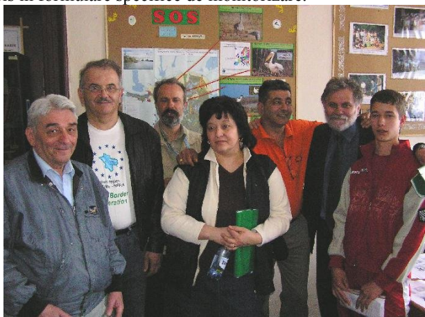
Voluntarii EKO BREG de la Școala de Chimie și Medicină Vrsac

În data de 5 mai a.c. la Bazias și Socol pe malurile Dunării și Nerei a avut loc prima monitorizare alternativă a mediului în zona rezervației naturale Balta Nera – Dunăre. Cu această ocazie voluntarii aparținând organizațiilor GEC Nera, SPEO Caras Oravița, SKOLA PLUS Bela Crkva și Eko Breg Vrsac au colectat informații privind starea ecologică a rezervației pe care le-au înscris în formulare specifice de monitorizare.