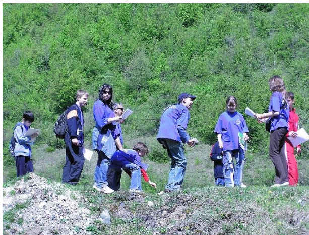
Voluntarii de la SKOLA PLUS Bela Crkva în acțiune de monitorizare a rezervației naturale Valea Ciclovei

În prima parte a întâlnirii, care a avut loc la sediul GEC Nera din Oravița, voluntarii împreună cu reprezentanții de la Administrația, Parcul Național Cheile Nerei-Beușnița, Rezervația naturală Deliblatska Peșcara (Dunele Deliblato) și Parcul Regional Vrșacke Planine (Munții Vârșetului) au stabilit împreună procedurile de monitorizare alternativă a mediului și un program de monitorizare pentru perioada mai – octombrie a.c. În continuare s-a realizat o aplicație practică de monitorizare alternativă a mediului în rezervația naturală Valea Ciclovei.